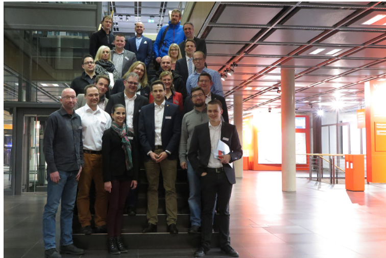
Abbildung 1: Wirtschaftsjunioren bei Viessmann in Allendorf